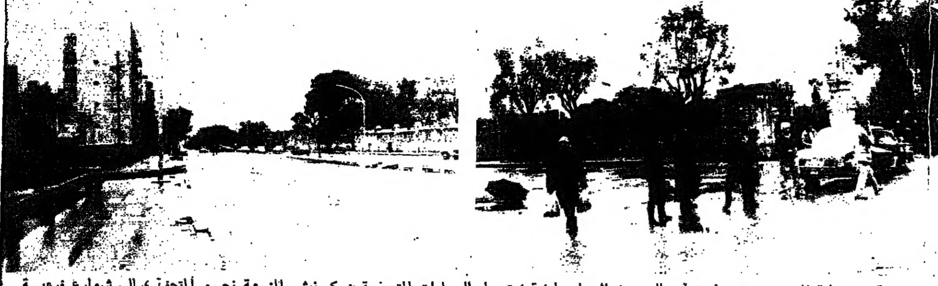
حركة المرور بين المنطقتين الشرقية والغربية من بيروت، كانت ضئيلة أمس، وخاصة عبر بوابة المتحف، وقد تولت قوات الردع، لأسباب أمنية، تحويل السيارات المتجهة من كورنيش المزرعة نحو المتحف، إلى شوارع فرعية كما يبدو في الصورة أعلاه.